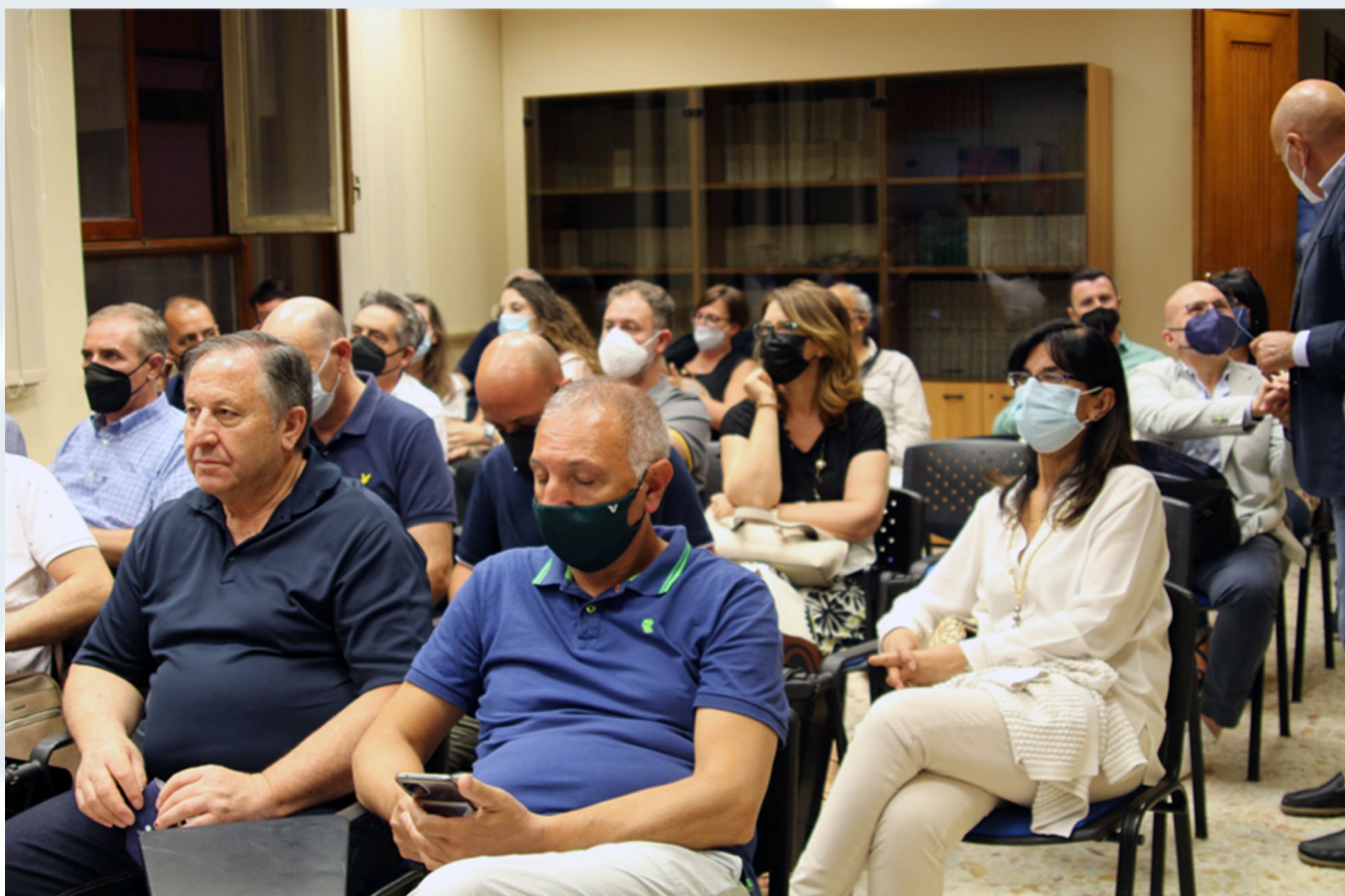
Assemblea Elettiva 2022 alcuni momenti dell'assemblea